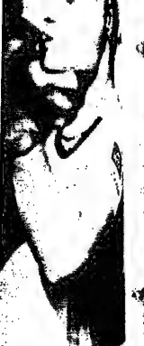
أزاري بطور الثمارة فرنسا المفتوحة